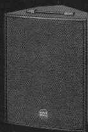
RS 152 XA