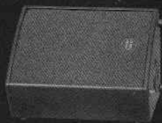
RS 122 MA